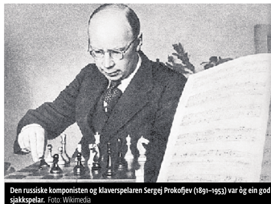
Den russiske komponisten og klaverspelaren Sergej Prokofjev (1891–1953) var òg ein god sjakkspelar.