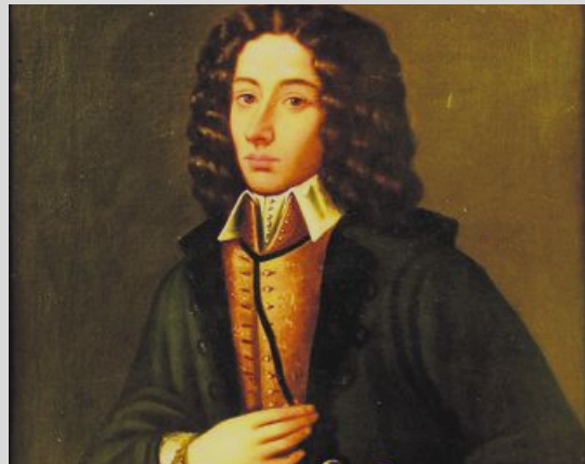
Den italienske barokkomponisten Giovanni Battista Pergolesi (1710–1736) døydde av tuberkulose alt som 26-åring.