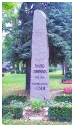
Nordraaks gravbauta i Jerusalem Kirkehof i Berlin.

«Nei, saa skal vi to store Mænd virkelig træffe hinanden!» utbraut Rikard Nordraak fyrste gong han møtte den eitt år yngre Edvard Grieg i Tivoli i København i 1864. Grieg, som dei fleste andre samtidige i norsk åndsliv, blei hugteken av denne raudhåra, unge mannen med det æregjerrige blikket og dei smale, energiske leppene. Ambisjonane lyste av han, skreiv Grieg i eit brev 20 år seinare: «Holdning, Gestus, Organ, alt tydede på, at jeg her befandt mig ligeoverfor en Mand, der følte sig som Fremtidens Bjørnson plus Ole Bull.» Det motsette av Grieg sjølv, altså, som kjende seg som «Elev, intet andet, der-til frygtsom, menneskesky og sygelig». Det seier sitt at jamvel Nordraaks fetter Bjørnson, som vel åtte Noregs største ego, lét seg fengsla: «Jeg