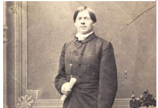
«Det mest henrivende unge Menneske, jeg har mødt», sa Bjørnson om den unge komponisten Rikard Nordraak (1843–1866).

tør nok sige, at i Omgang var han [Nordraak] det mest henrivende unge Menneske, jeg har mødt» og «den uden Sammenligning mest begavede».