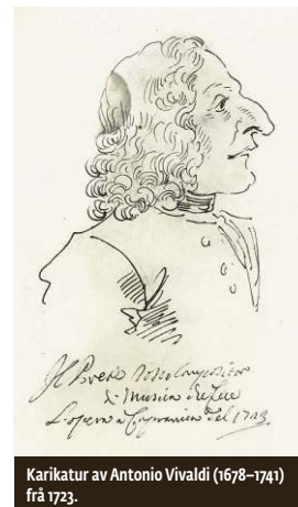
Karikatur av Antonio Vivaldi (1678–1741) frå 1723.