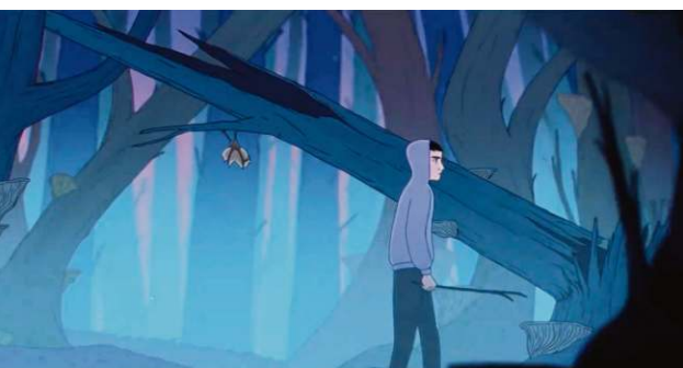
Bilete frå musikkvideoen som følgjer låten «Emerald Rush».

møte som på overflata kunne verke usannsynleg, men som når alt kom til alt, var perfekt. King Creosote var også med på Immunity (2013), som stadfesta Hopkins' posisjon som soloartist, utan at han fekk det for travelt. Han skulle altså la det gå fem år før neste album under eige namn kom ut.