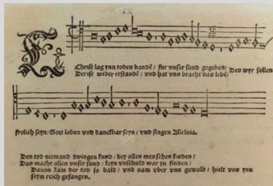
Tenorstemma til Luther-salmen «Christ lag in Todes Banden» frå Johann Walters Geystliches Gesangk Buchlein (1524).

Det er tolv stykke for firstemmig blandakor frå denne songboka det tyske ensemblet Weser-Renaissance gjev ut på dette nye albumet, musikk dei syng med god intonasjon, tydeleg tekstuttale og vedunderleg framføringsflyt. I desse kunstferdige renessansekomposisjonane ligg salmemelodien alltid i tenorstemma, ikkje i sopranen (toppstemma), slik me er