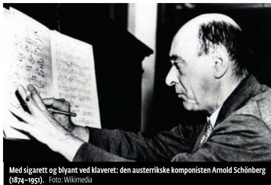
Med sigarett og blyant ved klaveret: den austerriske komponisten Arnold Schönberg (1874–1951).