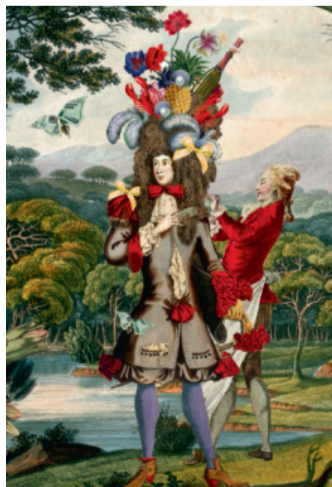
ILLUSTRASJON: ANETTE L'ORANGE / BLUNDERBUSS.NO / LAWO