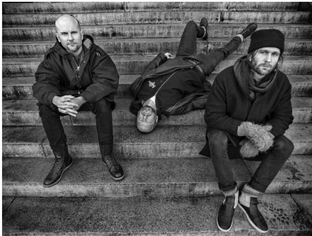
Tre flammer: Mats Gustafsson, Johan Berthling og Andreas Werliin opptre som tilnærmet likeverdige solister.