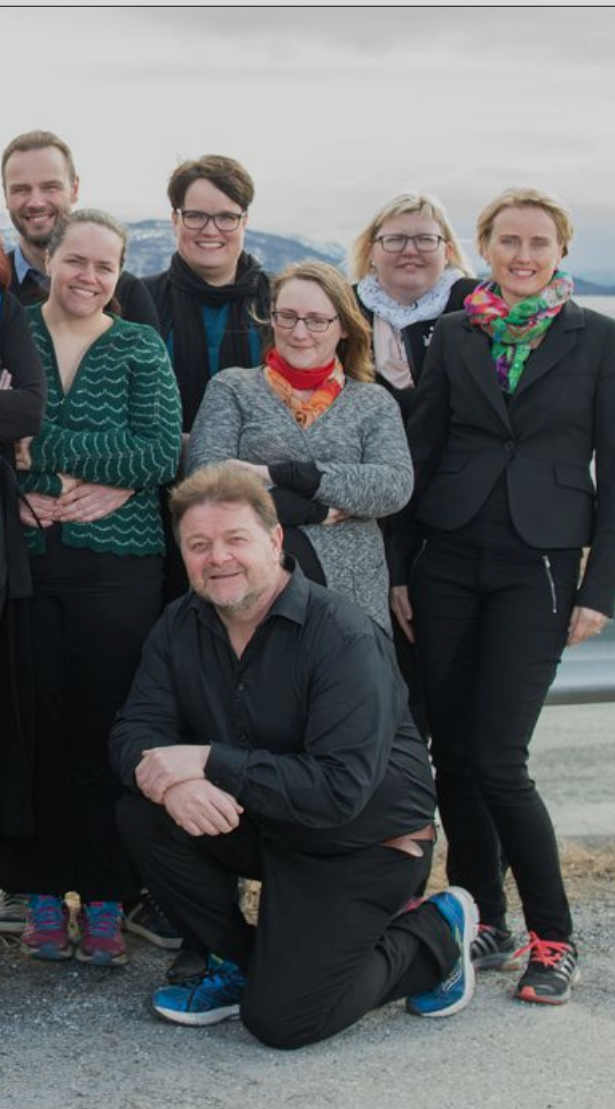
ble etablert i september 2016. Neste søndag, den 13. mai,

haugen – og etter et treffpunkt gjennom en konsert i Finnsneskirke som Frelsesarmeen arrangerte, kom også finnsnesværingene til.