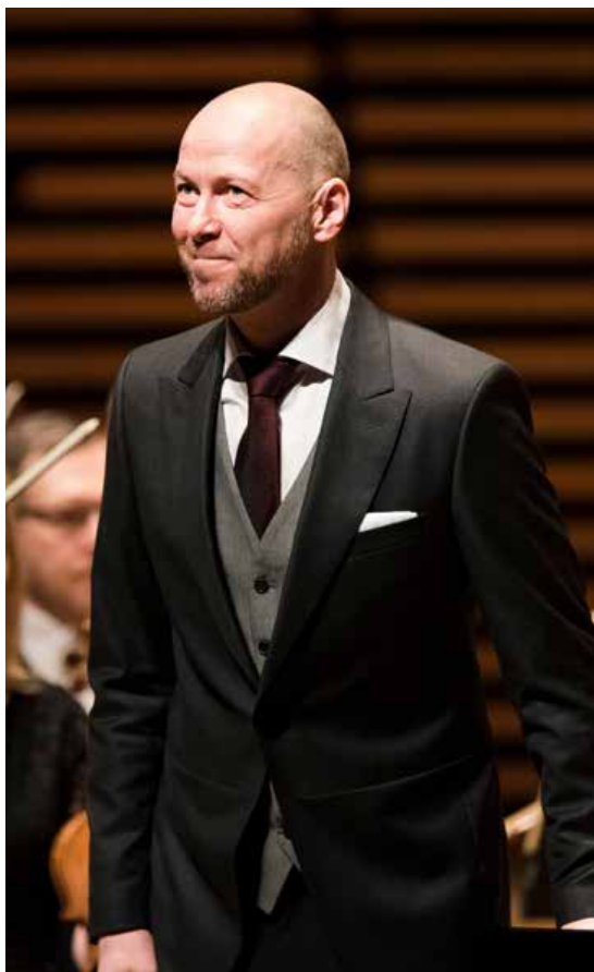
Sveinung Bjelland imponerer vår anmelder. Her fra en konsert med Stavanger symfoniorkester i 2017.