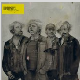
ALBUM DUMDUM BOYS «Armer og bein» (ohYeah! Records)

Mitt forhold til et av landets største rockband gjennom tidene har vært kronglet. Da den første EP-en og de to første skivene kom var jeg i slutten av tenårene og superfan.